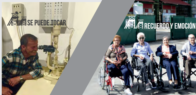
SE PUEDE TOCAR