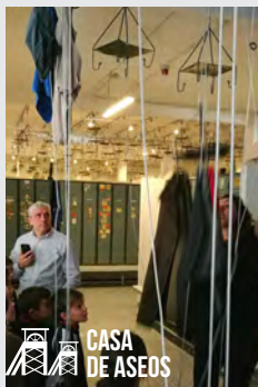
CASA DE ASEOS

Exposición fotográfica histórica y emotiva de momentos reales en la mina asturiana.